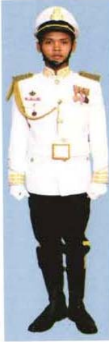
កងព្រៃទ័ព