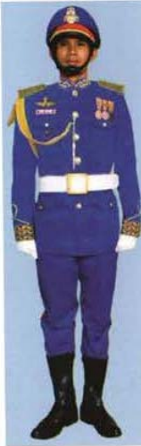
ជើងអាកាស